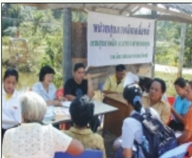
หน่วยบริการสุขภาพจิตเคลื่อนที่