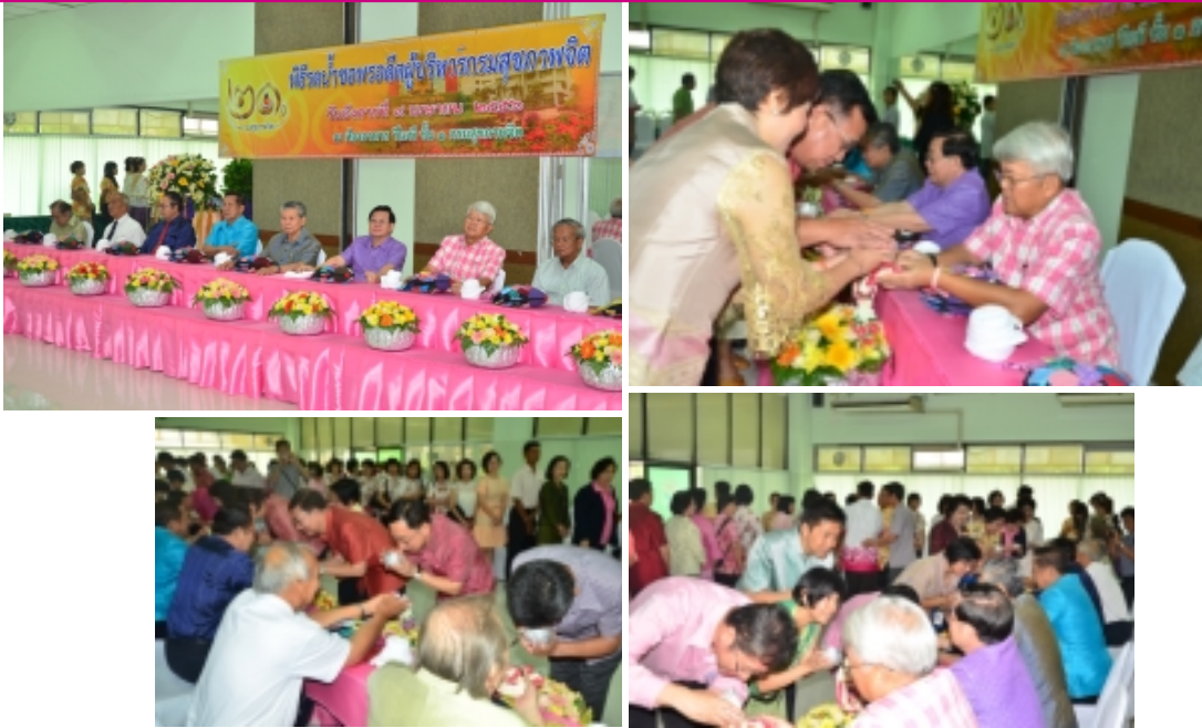
พิธีรดน้ำขอพรอดีตผู้บริหารกรมสุขภาพจิต ณ ห้องอาหาร VIP ชั้น 1