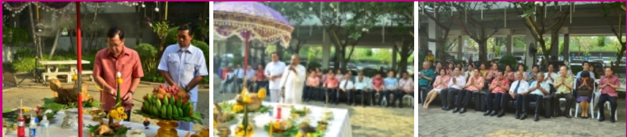
พิธีไหว้สิ่งศักดิ์สิทธิ์ ประจำปีกรมสุขภาพจิต