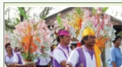
ทอดผ้าป่า รพ. 52