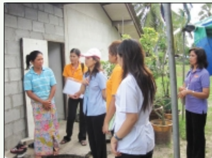
เยี่ยมยาที่ อ.คลองหอยโข่ง วันที่ 14 พ.ย. 53