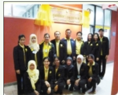
เปิดศูนย์เยี่ยมยา จ.ยะลา