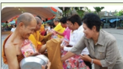
กิจกรรมทำบุญตักบาตรเนื่องในวันสำคัญทางศาสนา