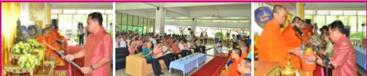
พิธีสงฆ์ สวดพระพุทธมนต์ ถวายเครื่องไทยธรรม พิธีสงฆ์หน้าพระพุทธรูป และผู้บริหารปลูกต้นไม้