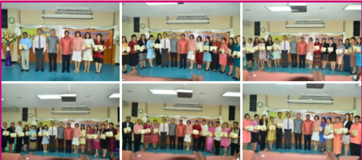
พิธีมอบโล่ประกาศเกียรติคุณ พิธีมอบโล่ประกาศเกียรติคุณแก่ข้าราชการพลเรือนดีเด่น ประจำปี 2555 และมอบของที่ระลึกแก่ข้าราชการเลื่อนระดับชำนาญการพิเศษ เชี่ยวชาญ ประจำปี 2555