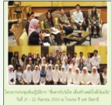
โครงการประชุมเชิงปฏิบัติการ "สื่อสารกับโลก เพื่อสร้างพลังแห่งใจใหม่" วันที่ 21 - 22 กันยายน 2553 ณ โรงแรม อิมพีเรียล ภูเก็ต