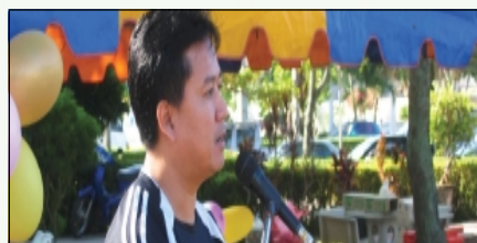
พิธีเปิดงานกีฬาภายในโรงพยาบาล